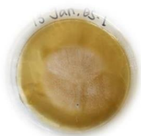
Gambar 1. Isolat Jamur Endofitik BS-1

berbentuk bulat dan memusat. Permukaan koloni jamur endofitik BS-1 cukup kasar, tipis dan tersebar merata ke semua permukaan media. Sedangkan pengamatan secara mikroskopis jamur endofitik BS-1 mempunyai spora dan hifa yang tidak bersekat menyerupai Chrysosporium spp [12].